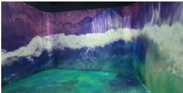
몰입형 공간 인터랙티브 미디어 아트 체험