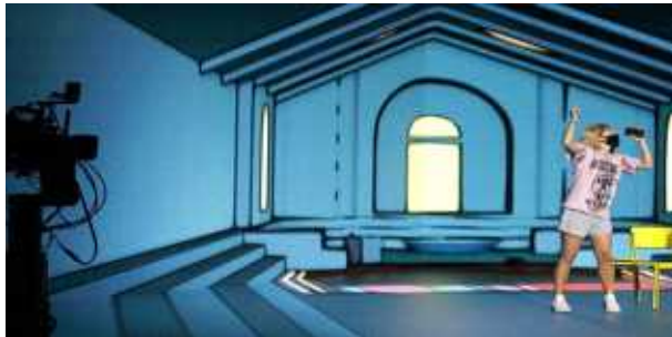
XR Stage 인터랙티브 콘텐츠 체험