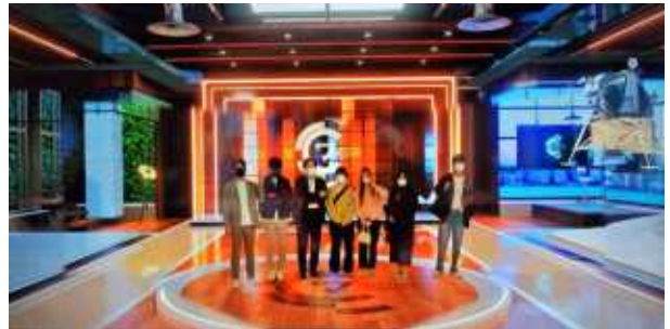
XR Stage 활용 사진, GIF 촬영